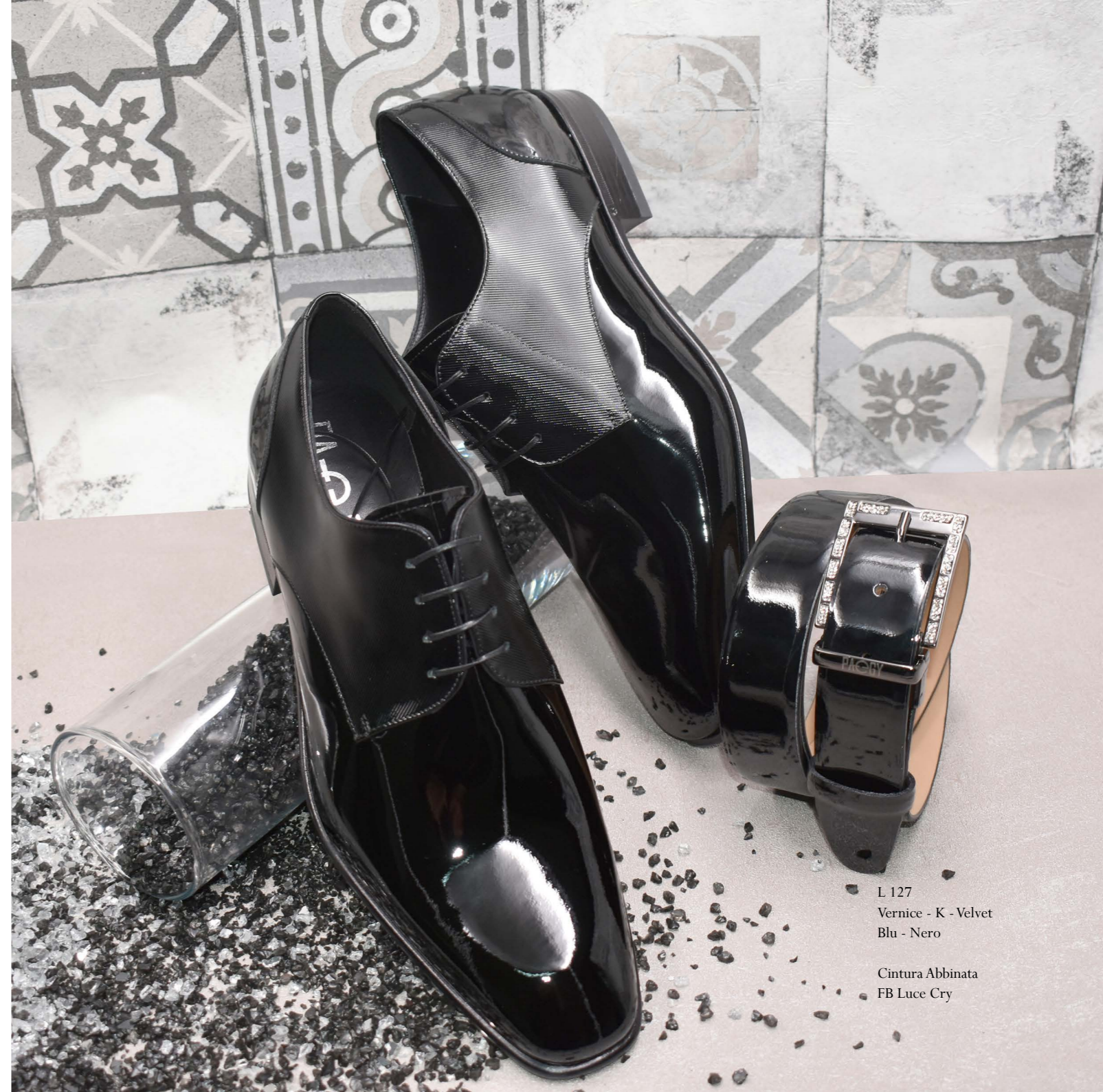
L 127 Vernice - K - Velvet Blu - Nero