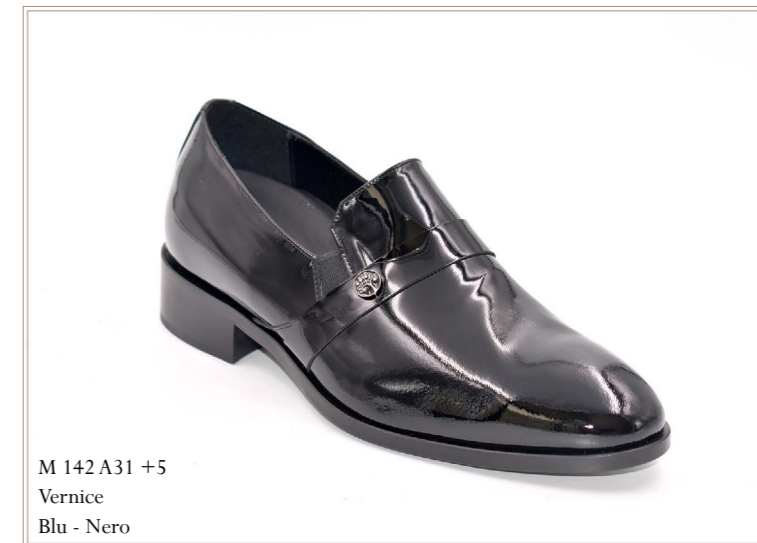
M 142A31 +5 Vernice Blu - Nero