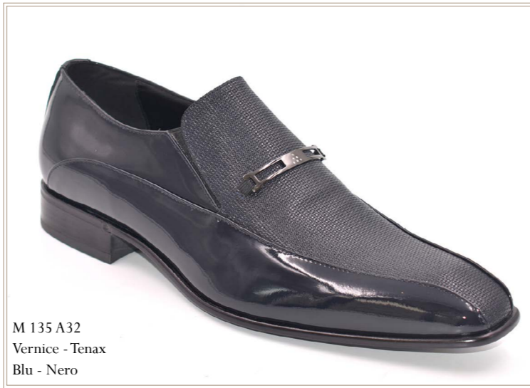
M 135 A32 Vernice - Tenax Blu - Nero