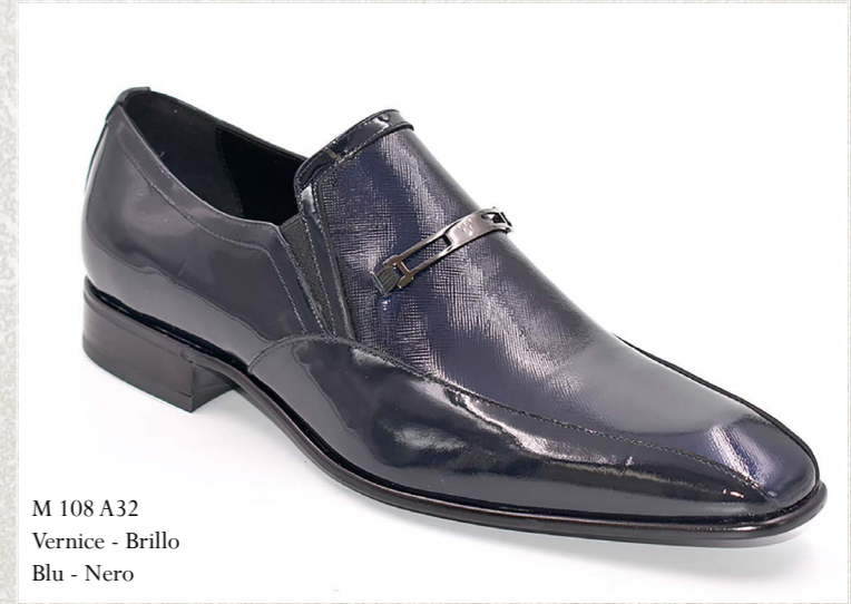
M 108 A32 Vernice - Brillo Blu - Nero