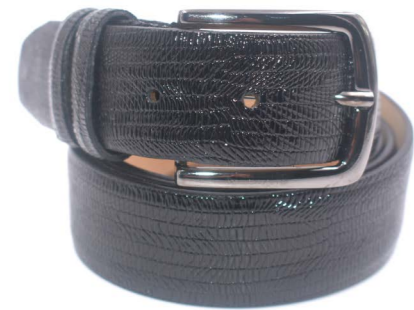
M 109 Vernice - Taormona Cintura Taormona Blu - Nero