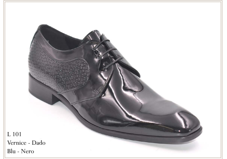
L 101 Vernice - Dado Blu - Nero