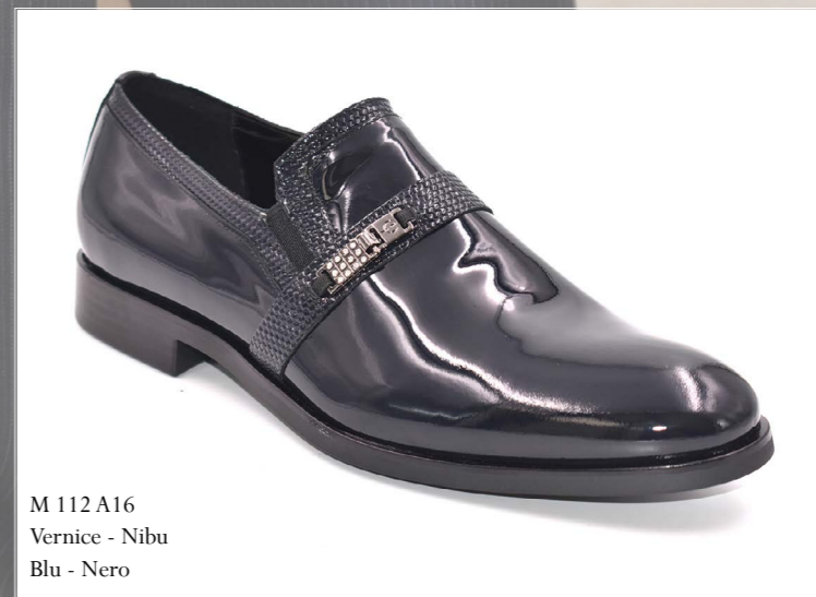
M 112 A16 Vernice - Nibu Blu - Nero