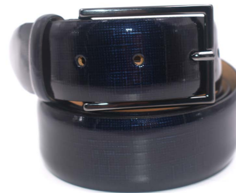
M 104 A15 Balla - Vernice Cintura Balla Blu - Cdf - Nero