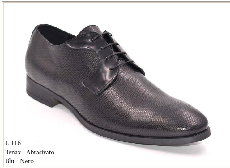
L 116 Tenax - Abrasivo Blu - Nero