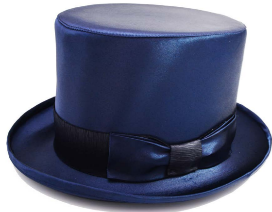
L 03 Vernice - Raso Cilindro in raso Blu - Nero