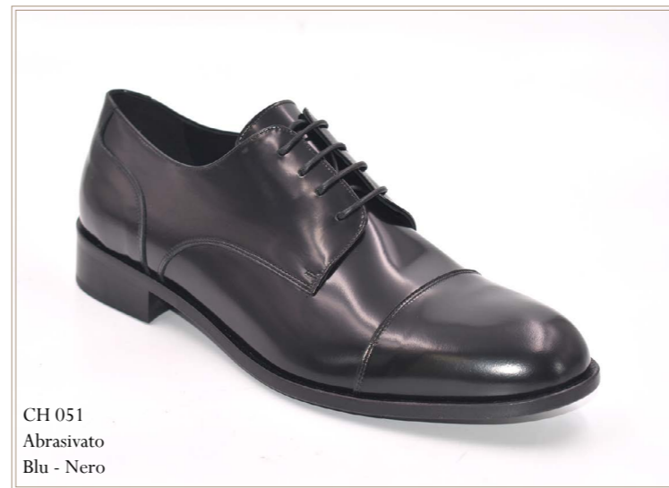
CH 051 Abrasive Blu - Nero