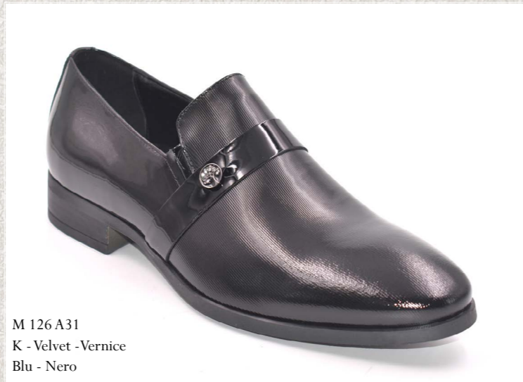
M 126 A31 K - Velvet - Vernice Blu - Nero