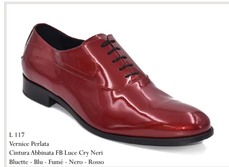
L 117 Vernice Perlata Cintura Abbinata FB Luce Cry Neri Bluette - Blu - Fumé - Nero - Rosso