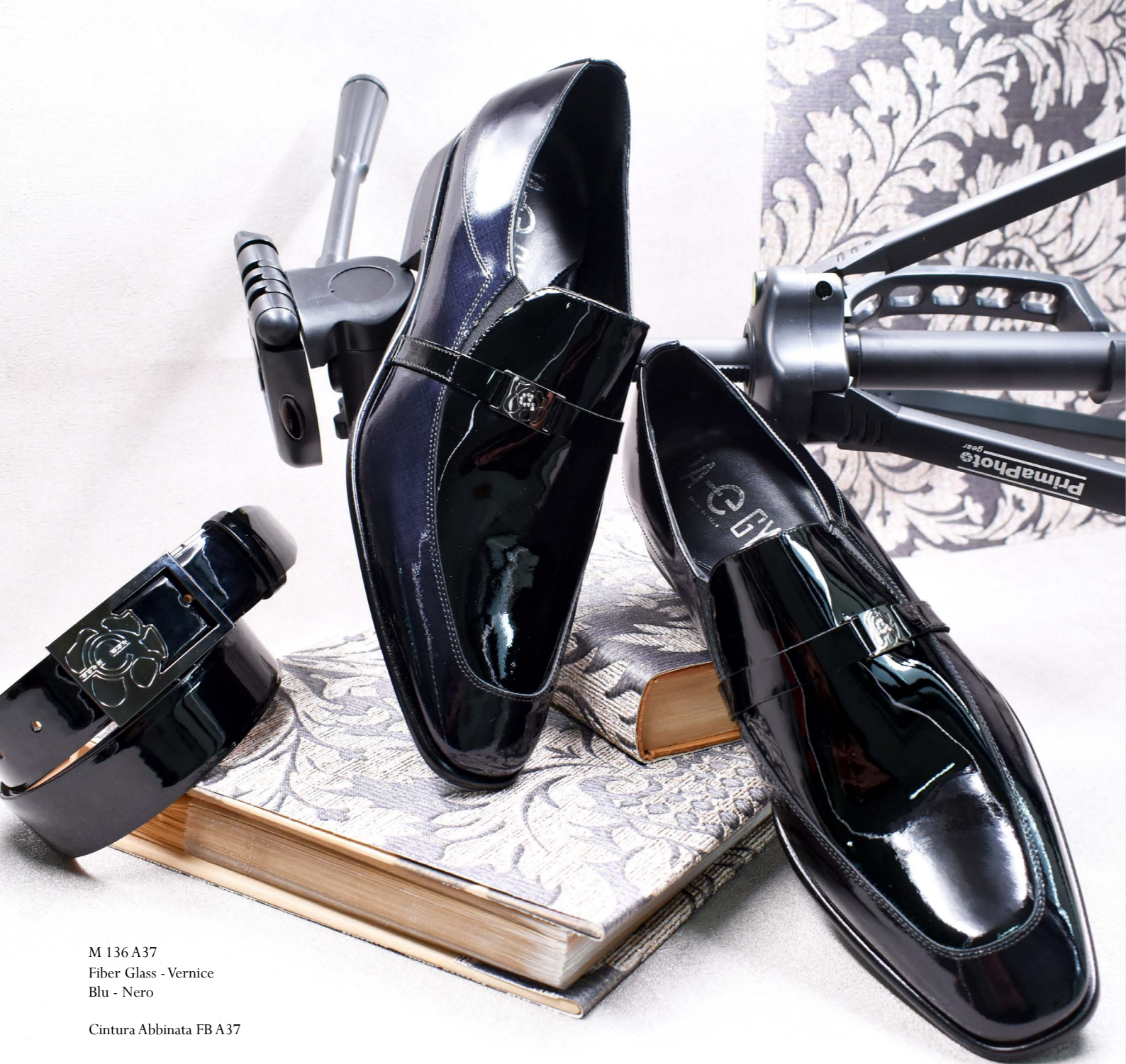
M 136 A37 Fiber Glass - Vernice Blu - Nero