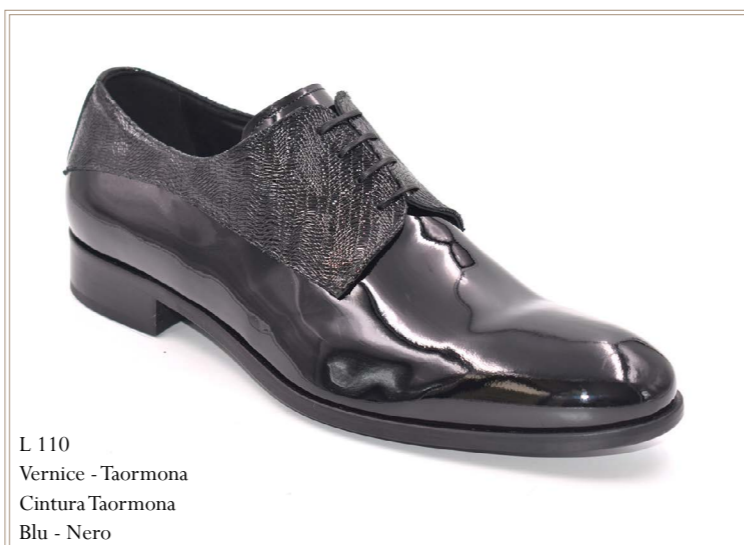
L 110 Vernice - Taormona Cintura Taormona Blu - Nero