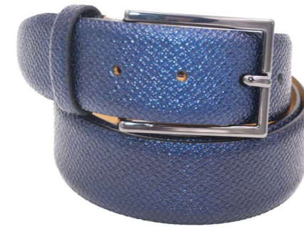
M 106 A16 Diamante - Vernice Cintura Diamante Blu Navy - Nero