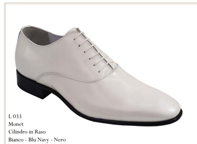
L 033 Monet Cilindro in Raso Bianco - Blu Navy - Nero