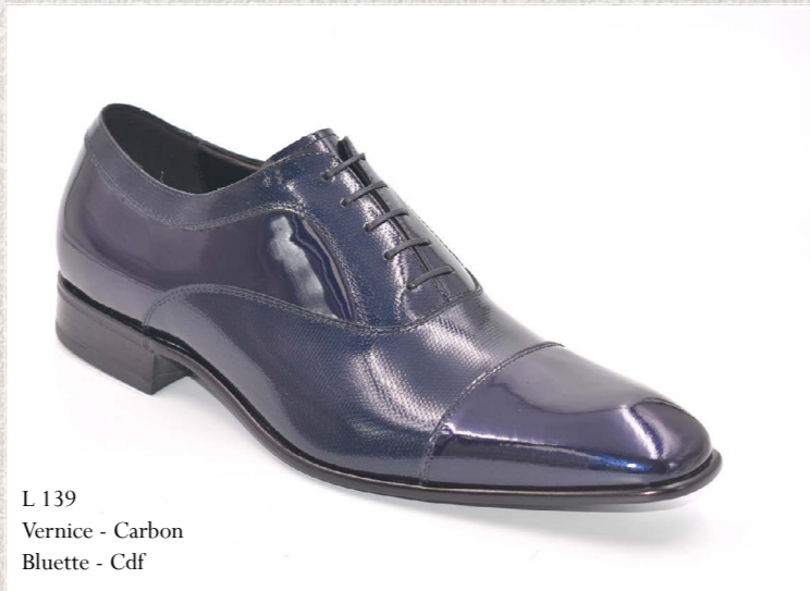
L 139 Vernice - Carbon Bluette - Cdf