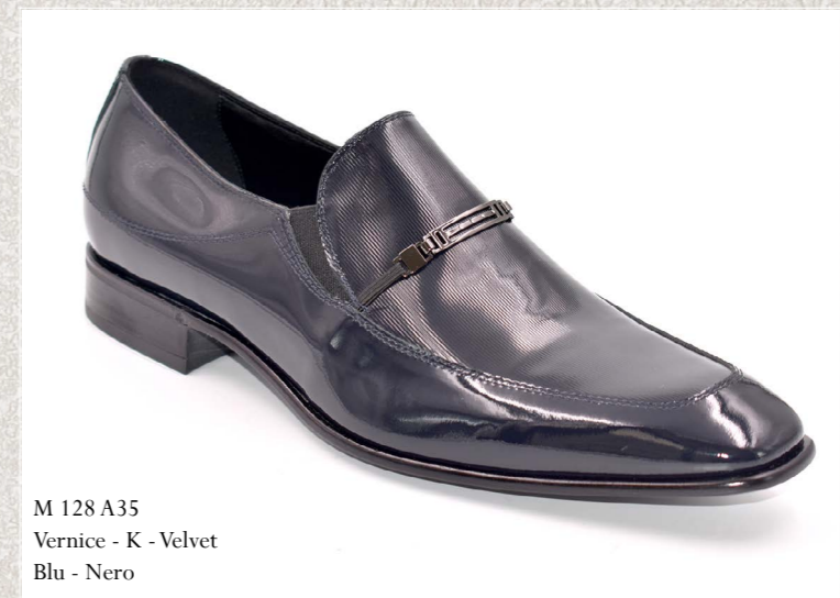
M 128 A35 Vernice - K - Velvet Blu - Nero