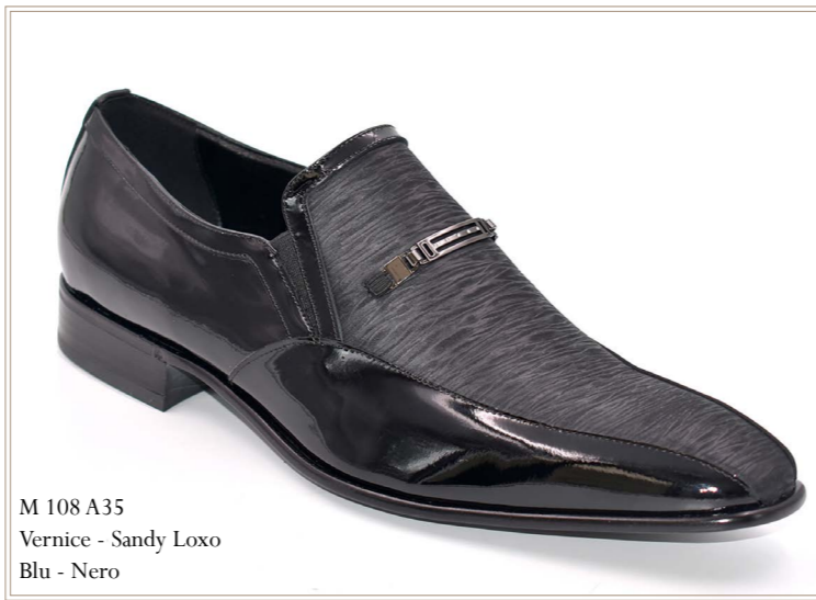
M 108 A35 Vernice - Sandy Loxo Blu - Nero