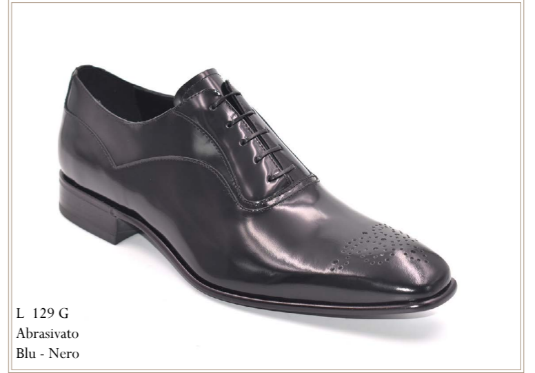
L 129 G Abrasive Blu - Nero