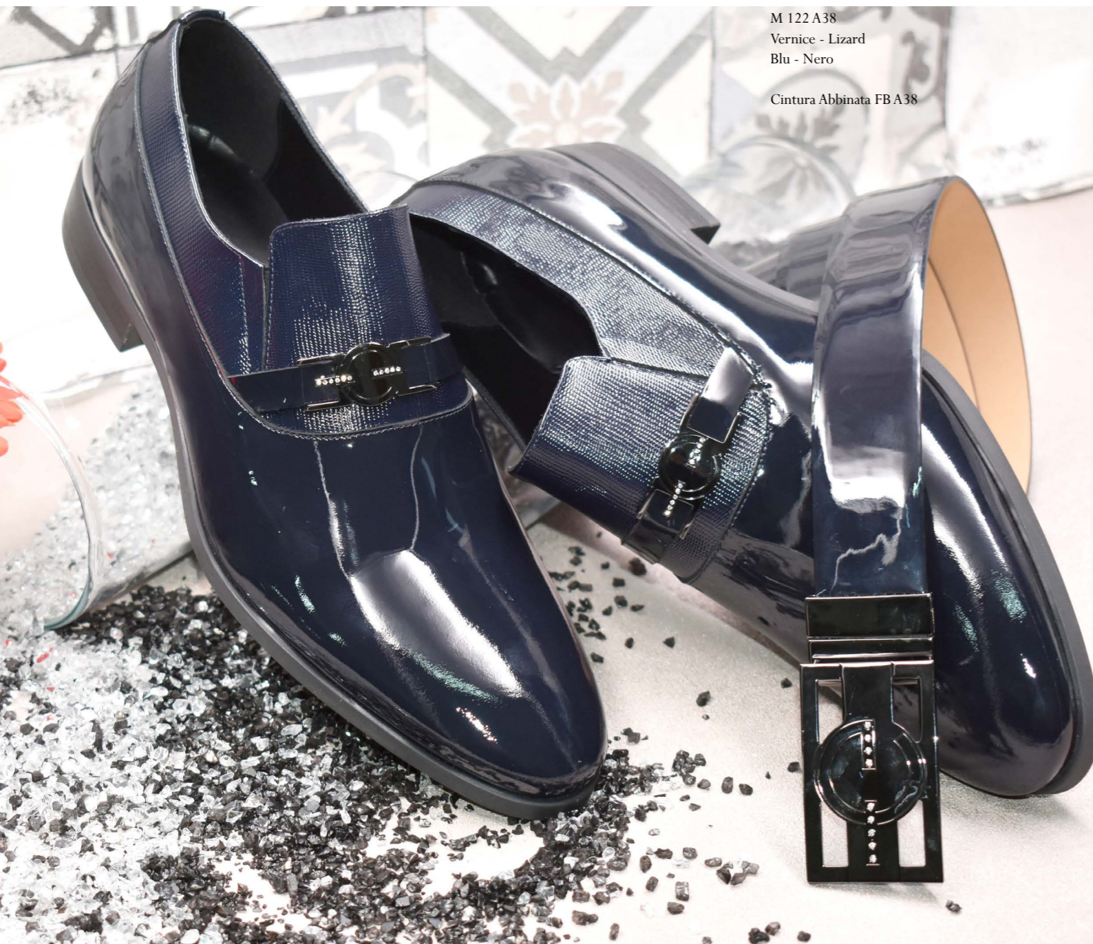
M 122 A38 Vernice - Lizard Blu - Nero Cintura Abbinata FB A38