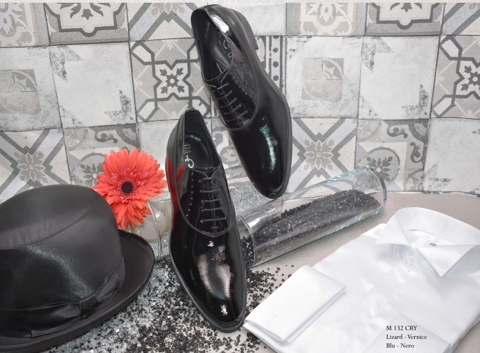
M 132 CRY Lizard - Vernice Blu - Nero