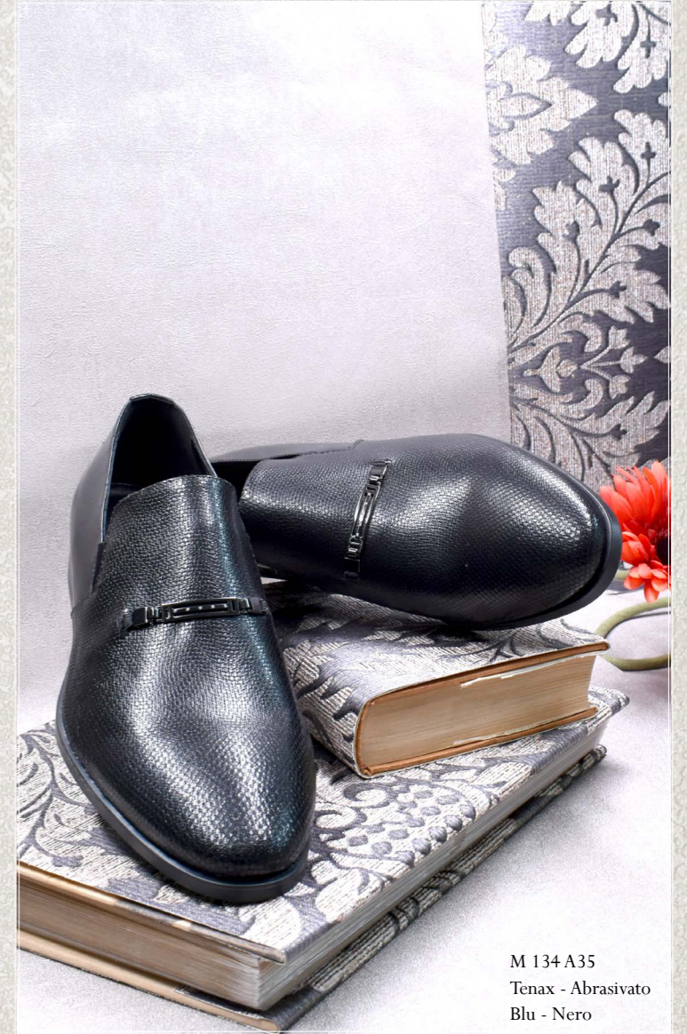
M 134 A35 Tenax - Abrasivato Blu - Nero