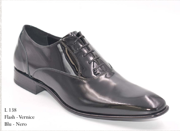
L 138 Flash - Vernice Blu - Nero