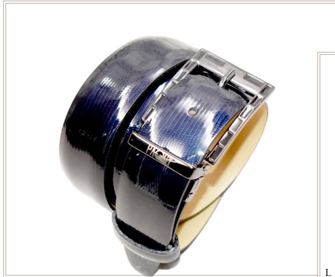
L 10 Minitejus - Raso Cintura Minitejus FB Vernice Blu Navy - Nero