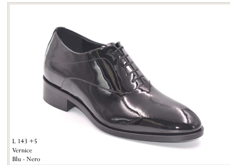
L 143 +5 Vernice Blu - Nero

Plantare anatomico in poliuretano espanso.