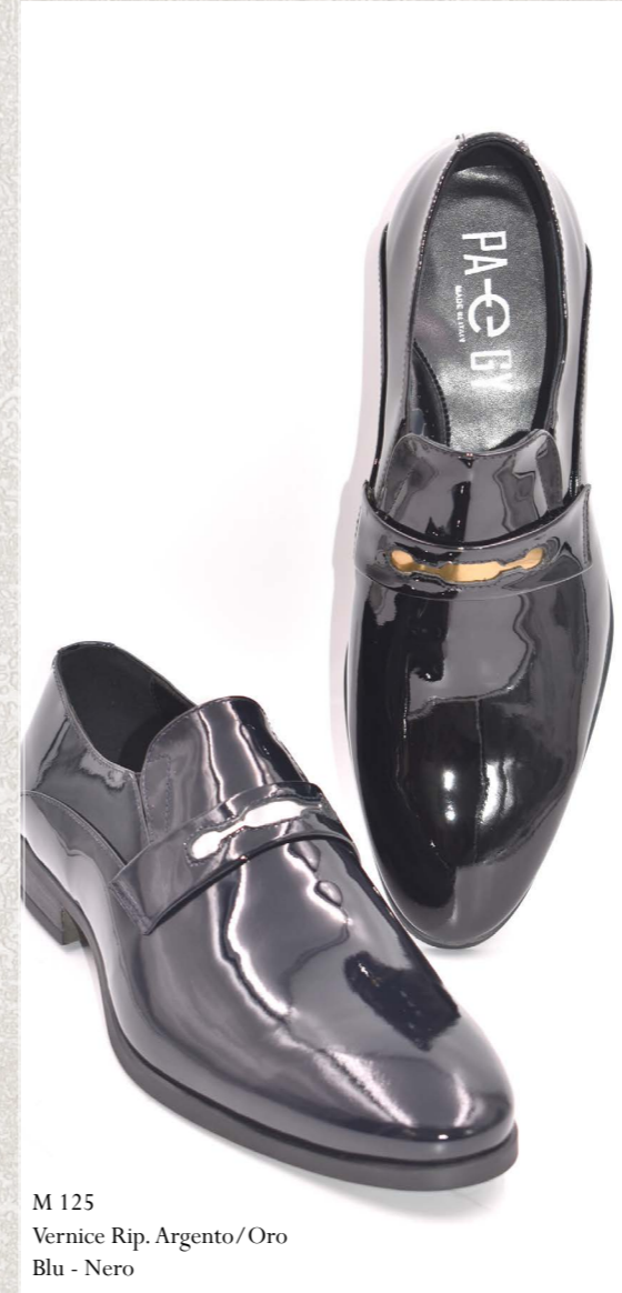
M 125 Vernice Rip. Argento/Oro Blu - Nero