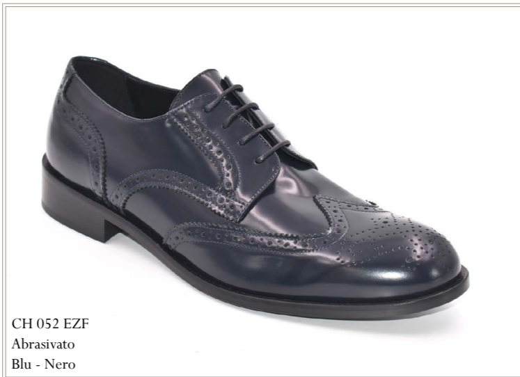
CH 052 EZF Abrasive Blu - Nero