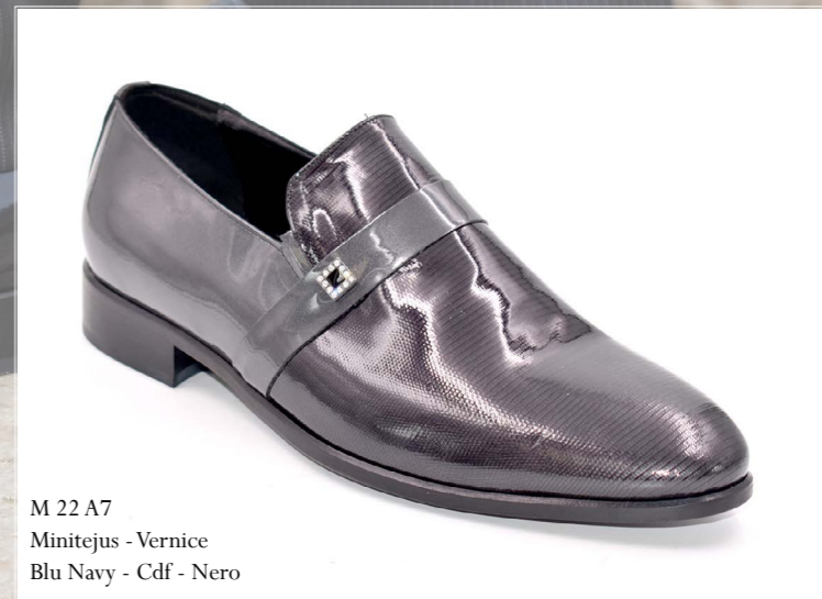
M 22 A7 Minitejus - Vernice Blu Navy - Cdf - Nero