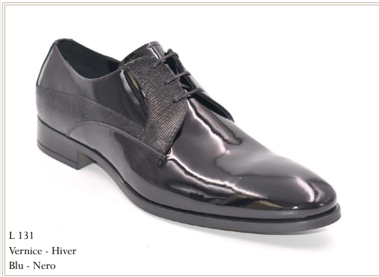
L 131 Vernice - Hiver Blu - Nero