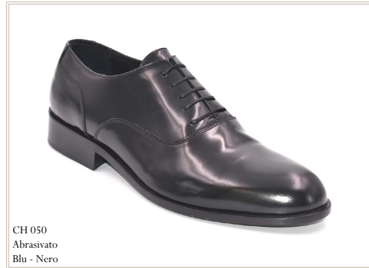
CH 050 Abrasive Blu - Nero