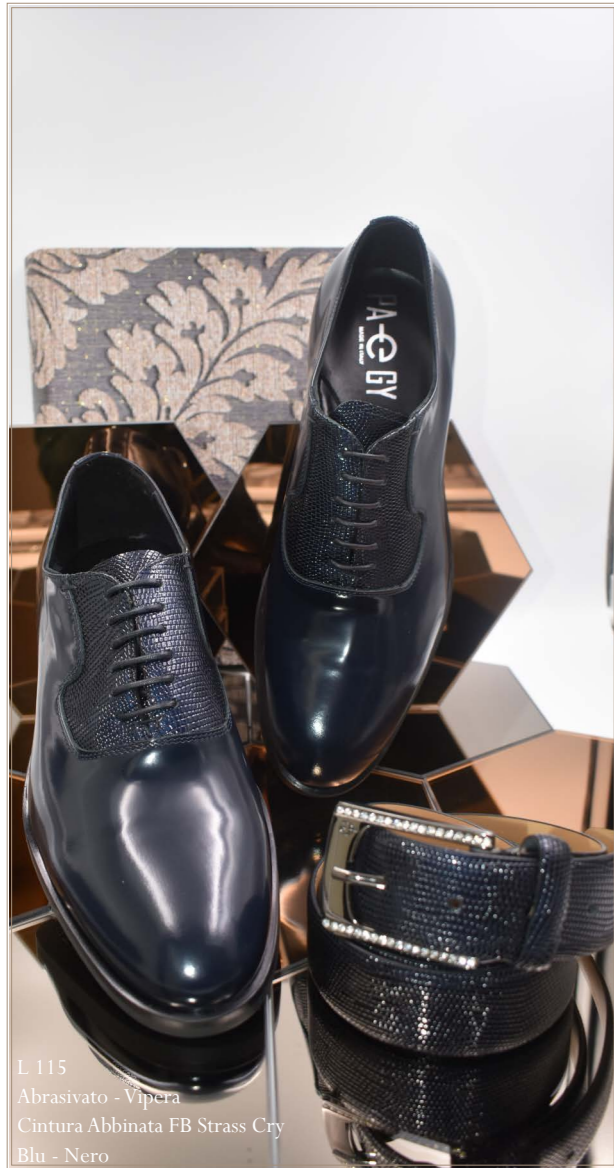
L 115 Abrasive - Vipera Cintura Abbinata FB Strass Cry Blu - Nero