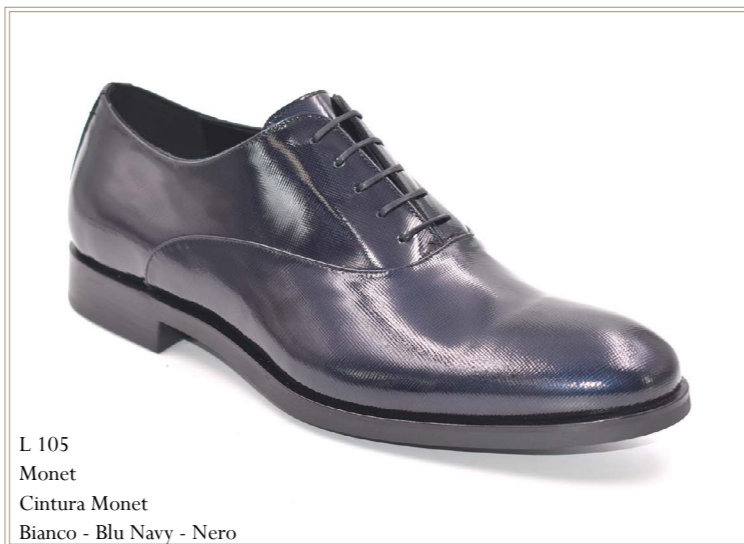
L 105 Monet Cintura Monet Bianco - Blu Navy - Nero