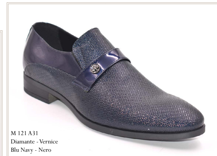
M 121 A31 Diamante - Vernice Blu Navy - Nero