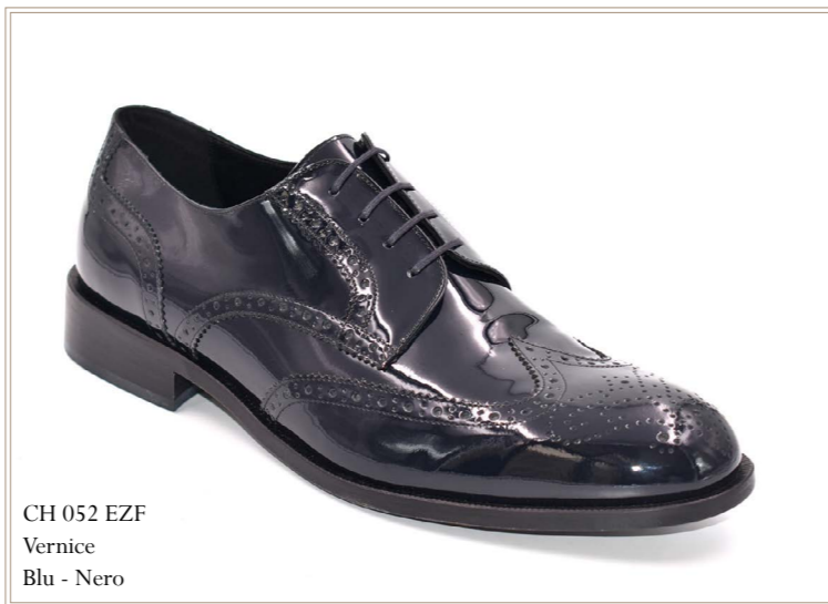
CH 052 EZF Vernice Blu - Nero