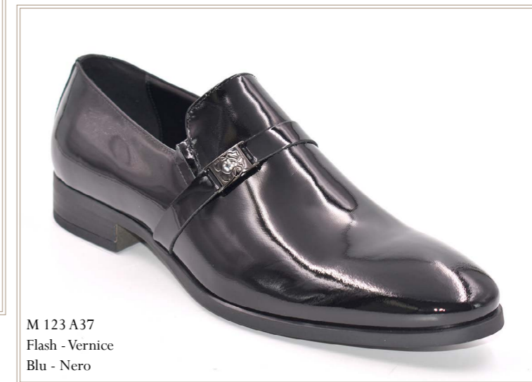
M 123 A37 Flash - Vernice Blu - Nero