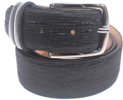
M 108 A15 Vernice - Aqua Cintura Aqua Blu - Nero