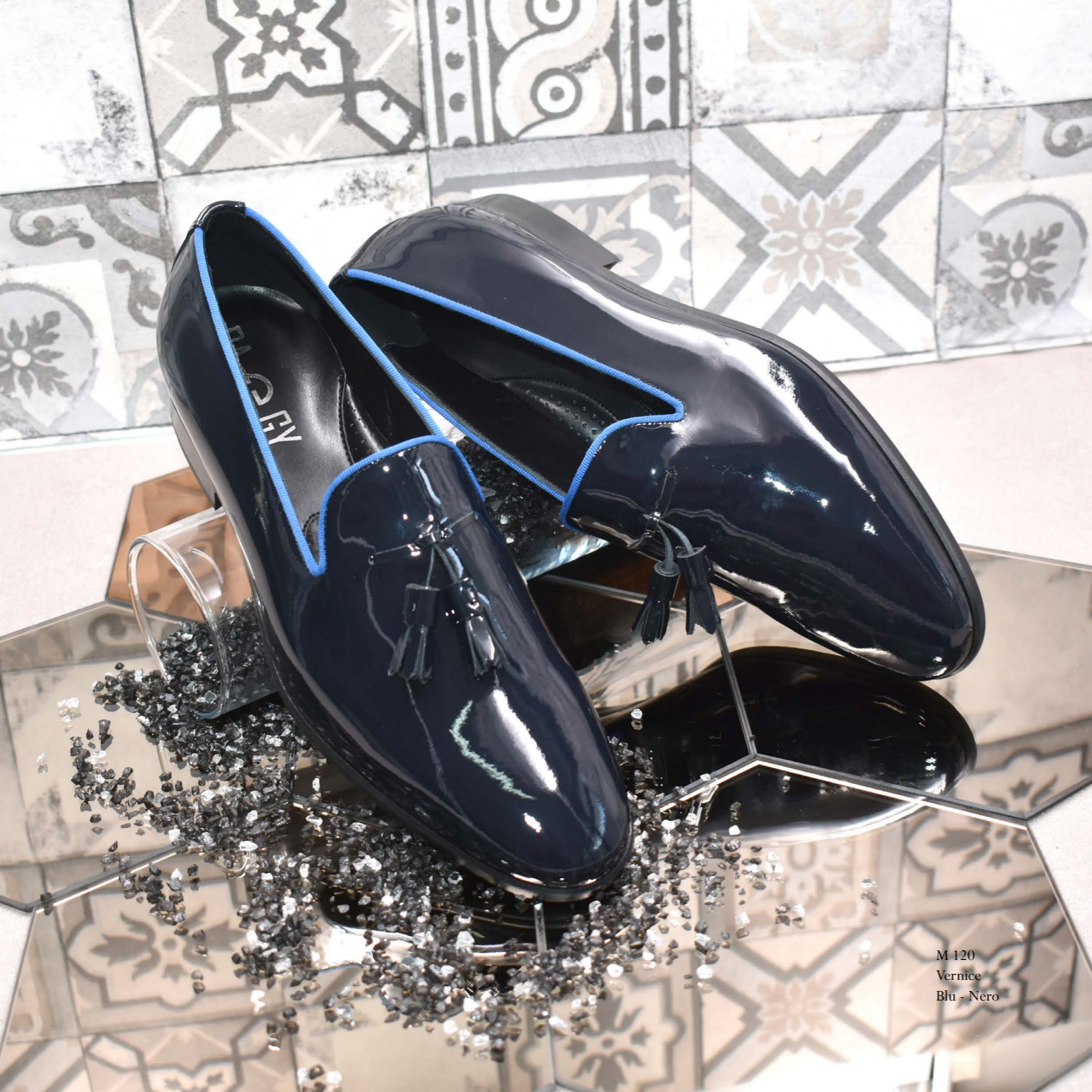
M 120 Vernice Blu - Nero

Aumenta l'altezza... ...senza perdere la comodità .