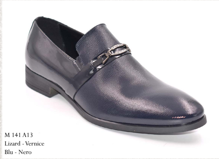
M 141 A13 Lizard - Vernice Blu - Nero